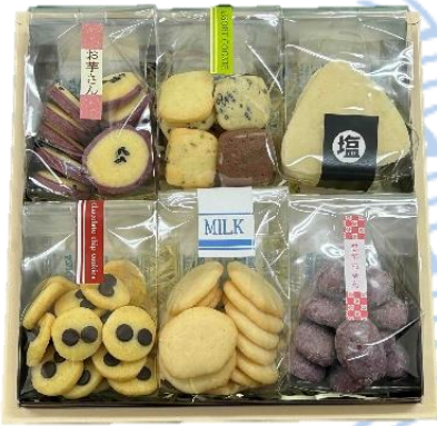
A セット 6個入り 2,000円〔税込〕