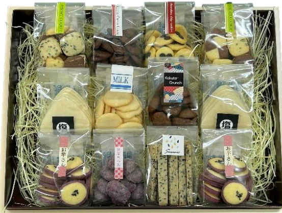
C セット 12個入り 3,730円〔税込〕