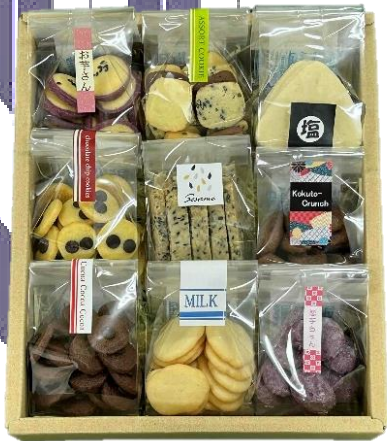
B セット 9個入り 2,840円〔税込〕