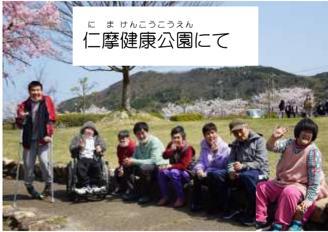
にまけんこうこうえん 仁摩健康公園にて